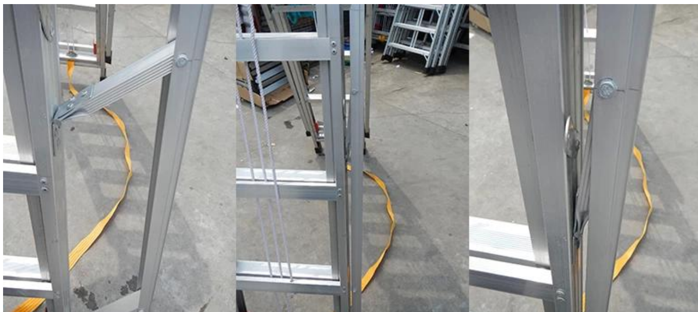
Строительство экстра-рустпруф алюминиевого сплава